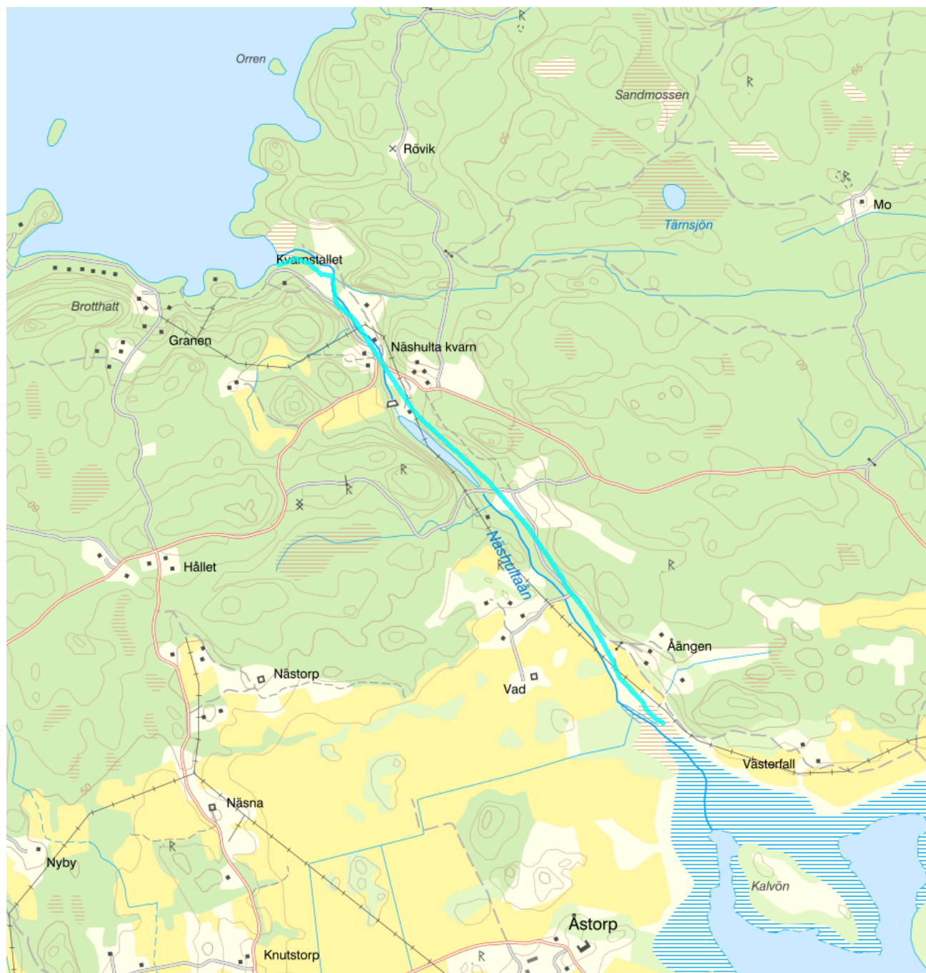
Förvaltningscykel 3 (2017 - 2021)