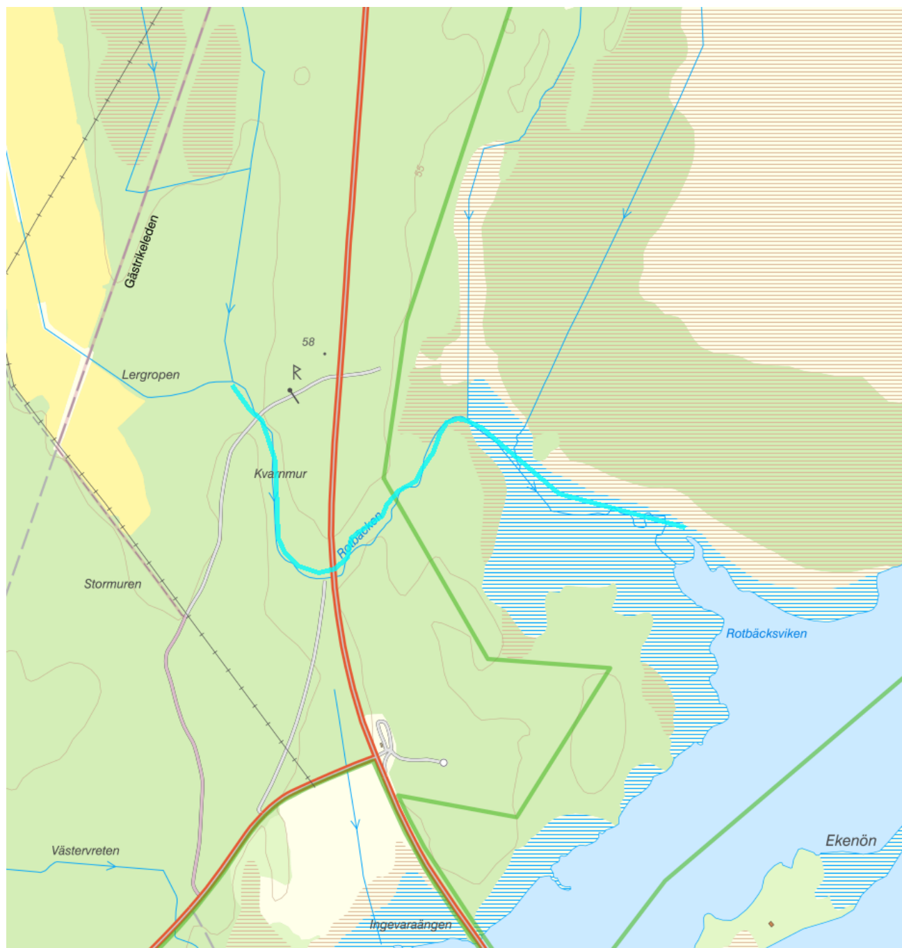
Förvaltningscykel 3 (2017 - 2021)