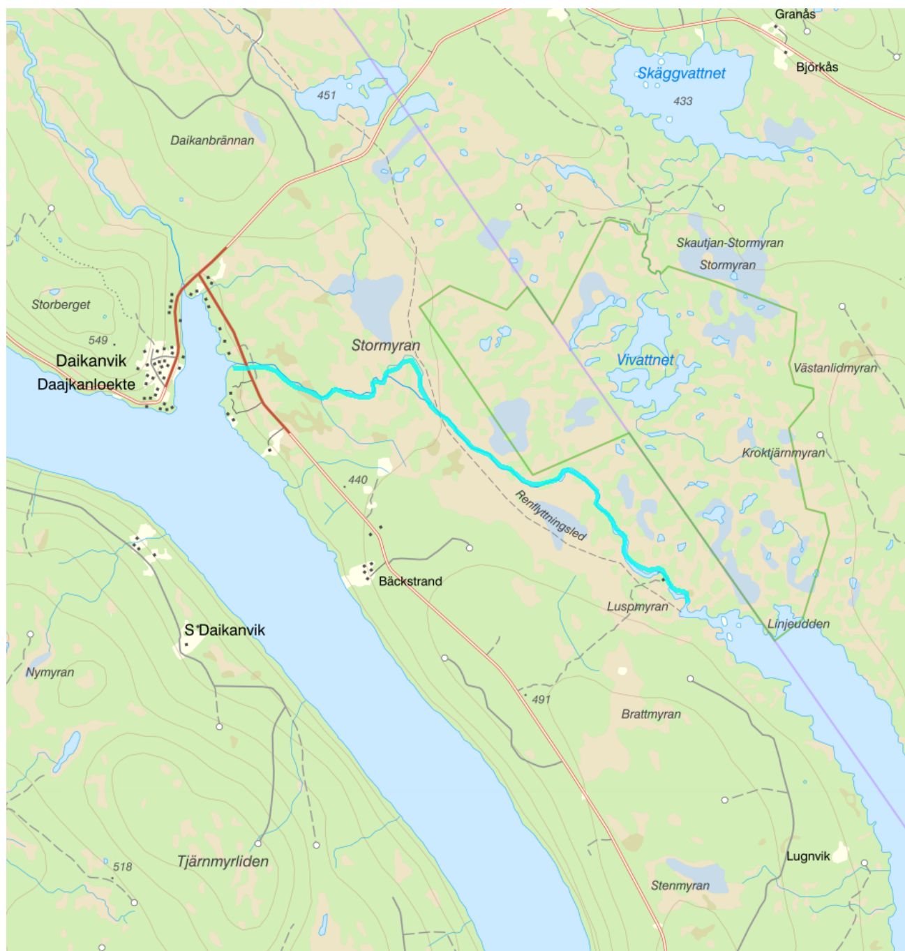
Förvaltningscykel 3 (2017 - 2021)