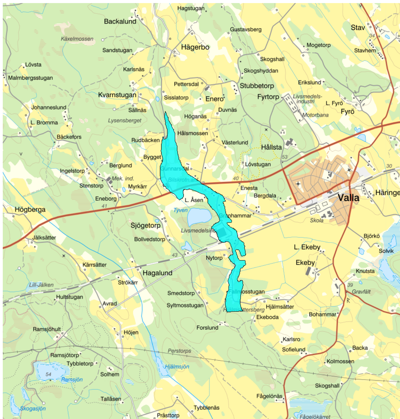
Förvaltningscykel 1 (2004 - 2009)

SE654406-153074 - WA35249292 / SE654406-153074