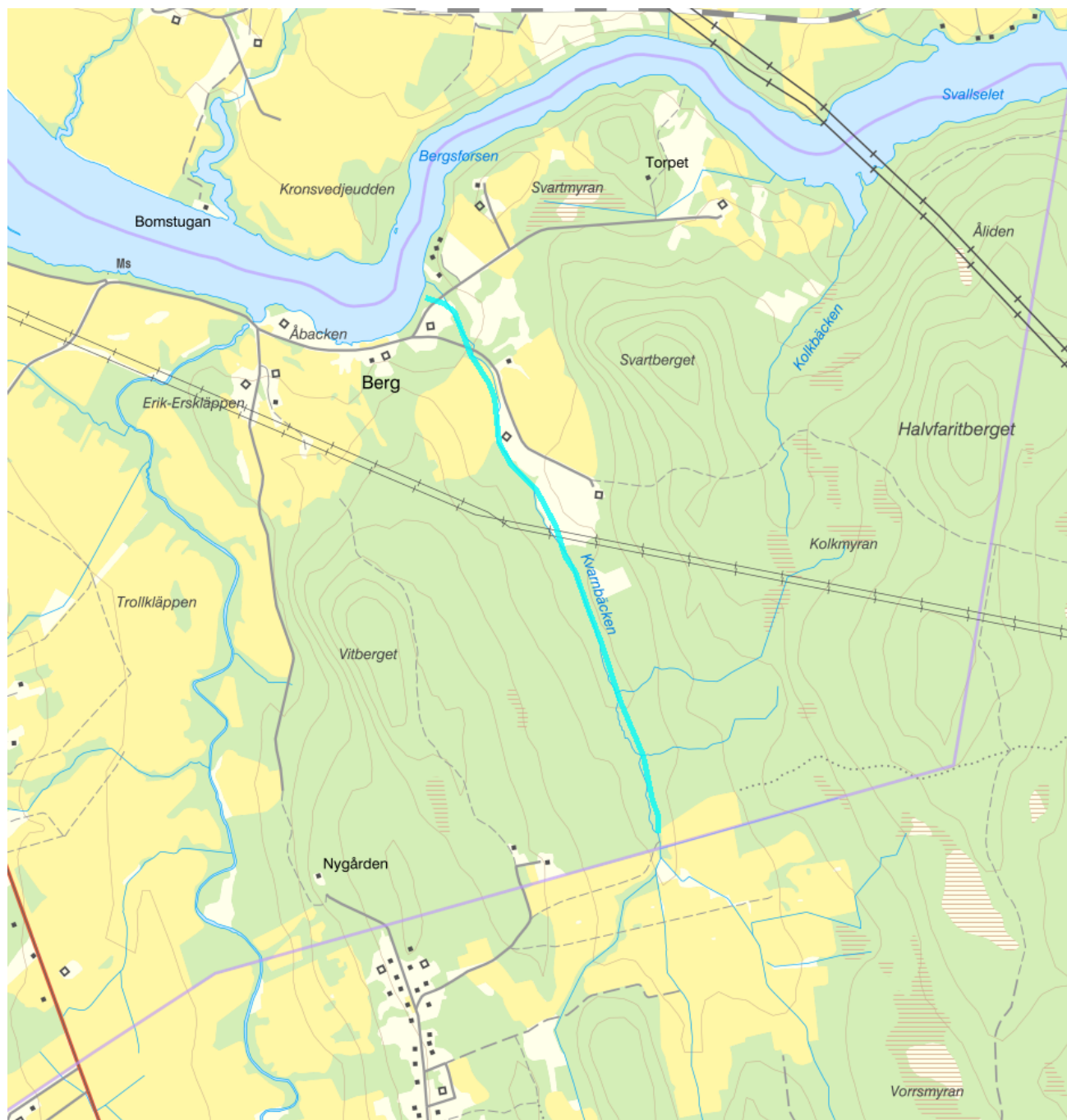
Förvaltningscykel 3 (2017 - 2021)