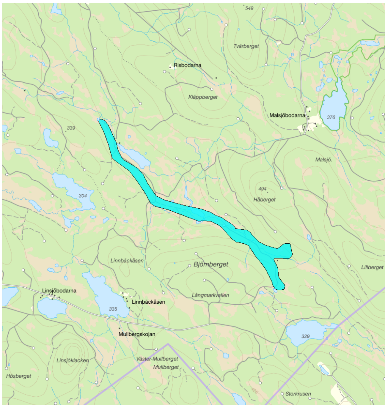
Förvaltningscykel 1 (2004 - 2009)