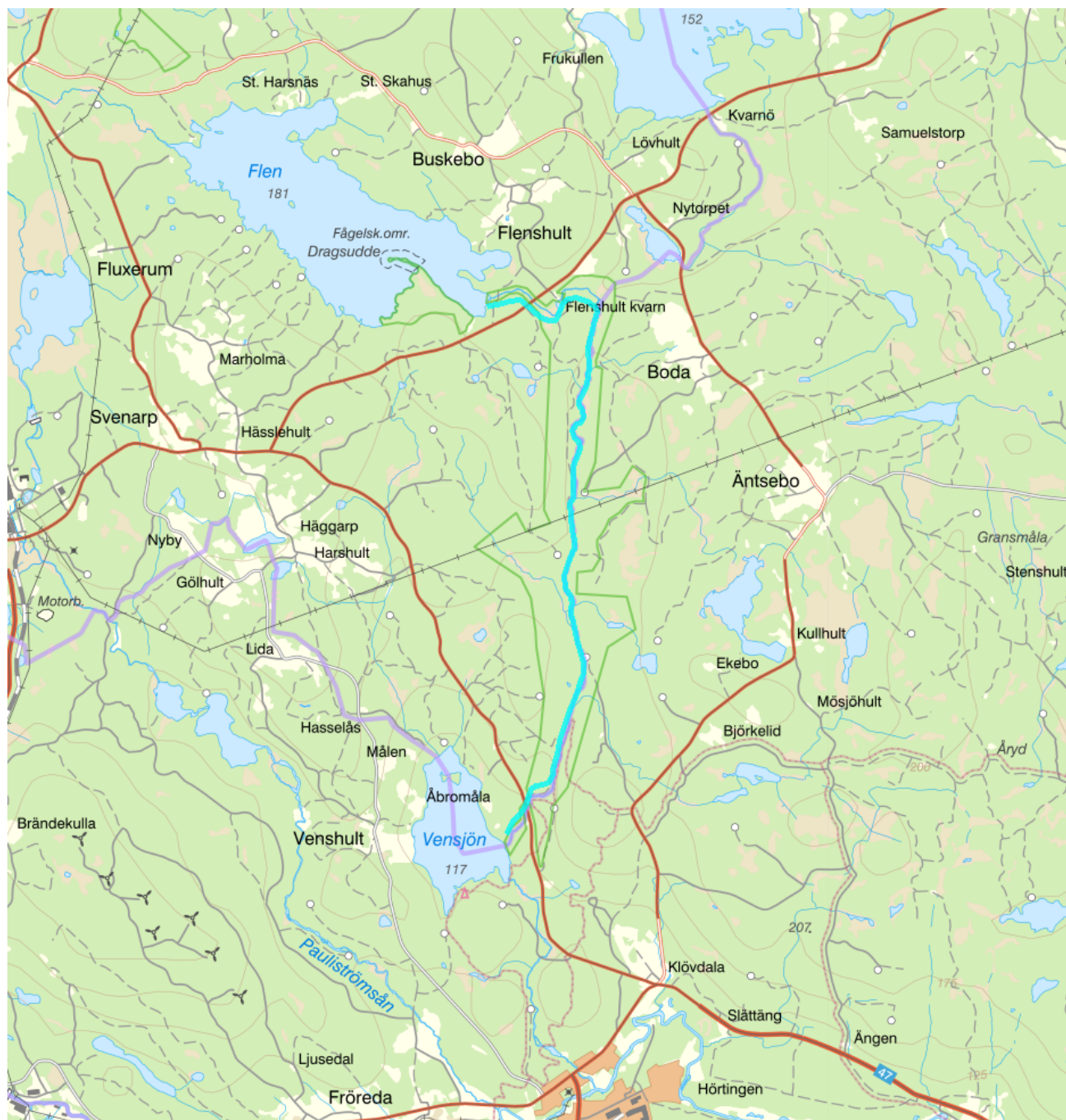
Förvaltningscykel 3 (2017 - 2021)