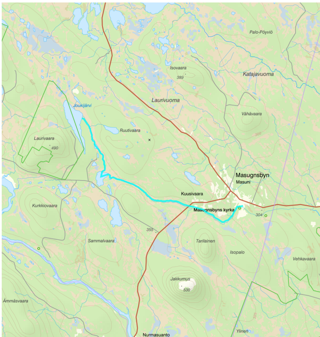
Förvaltningscykel 3 (2017 - 2021)