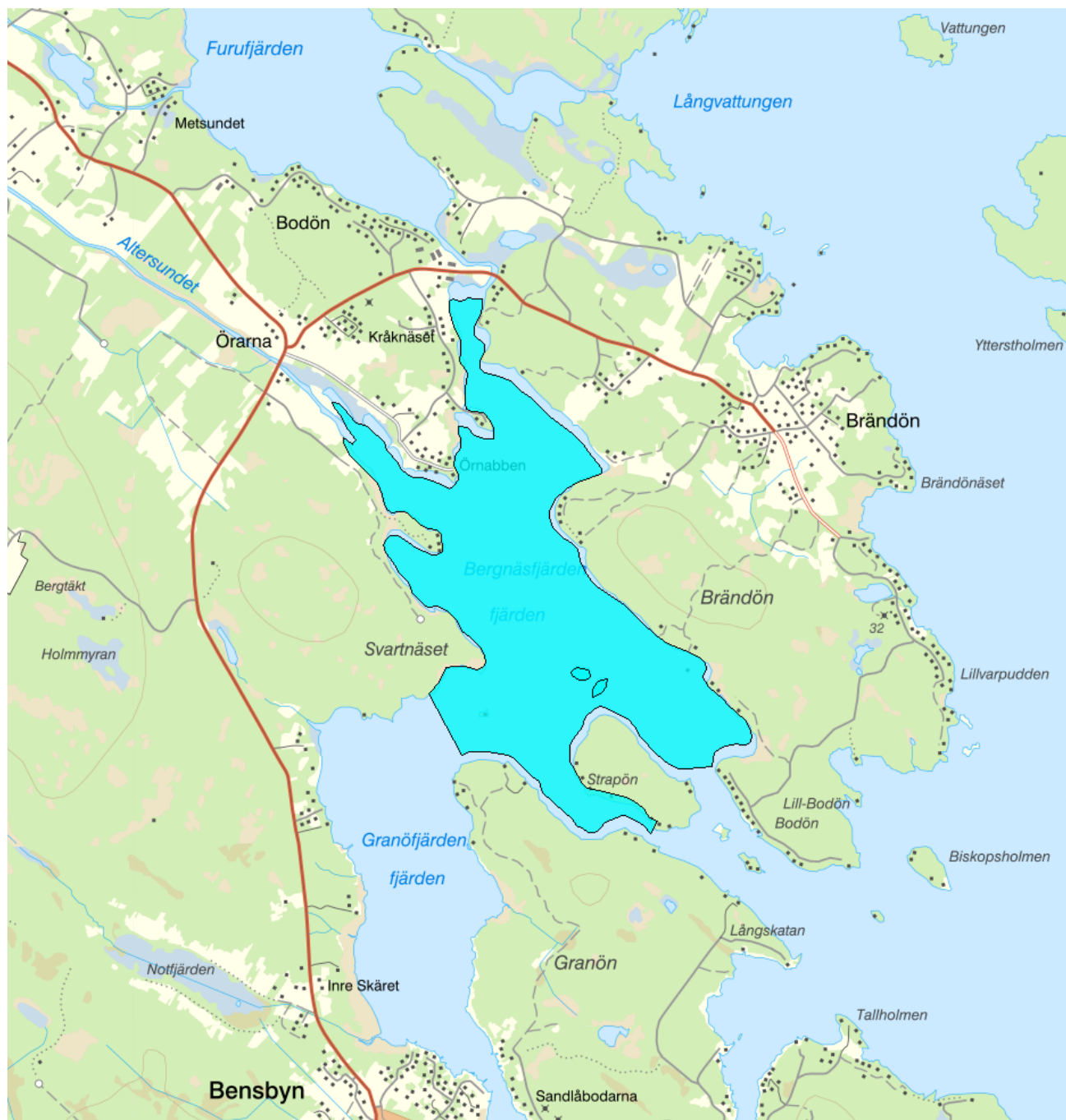
Förvaltningscykel 3 (2017 - 2021)