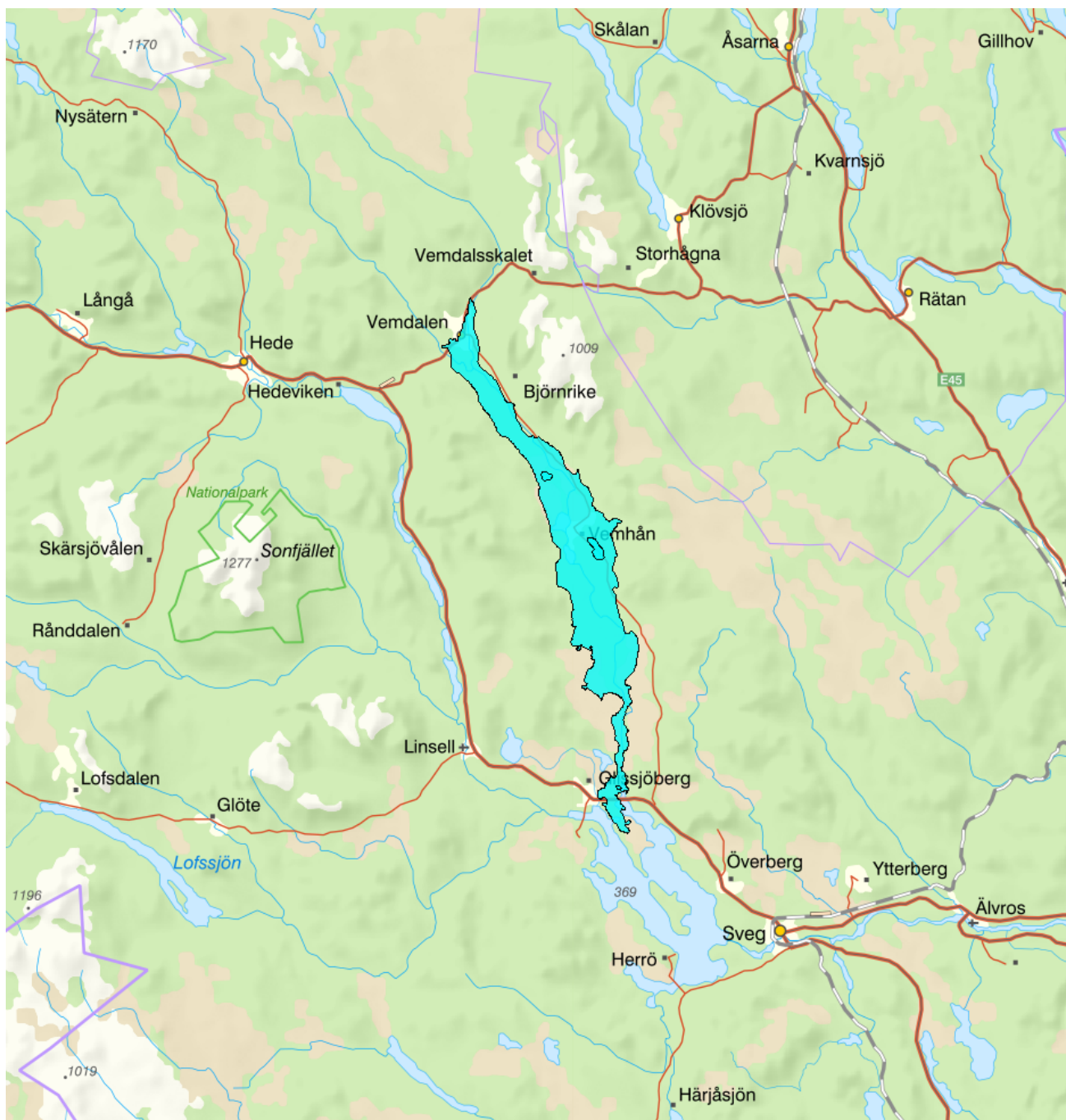
Förvaltningscykel 3 (2017 - 2021)