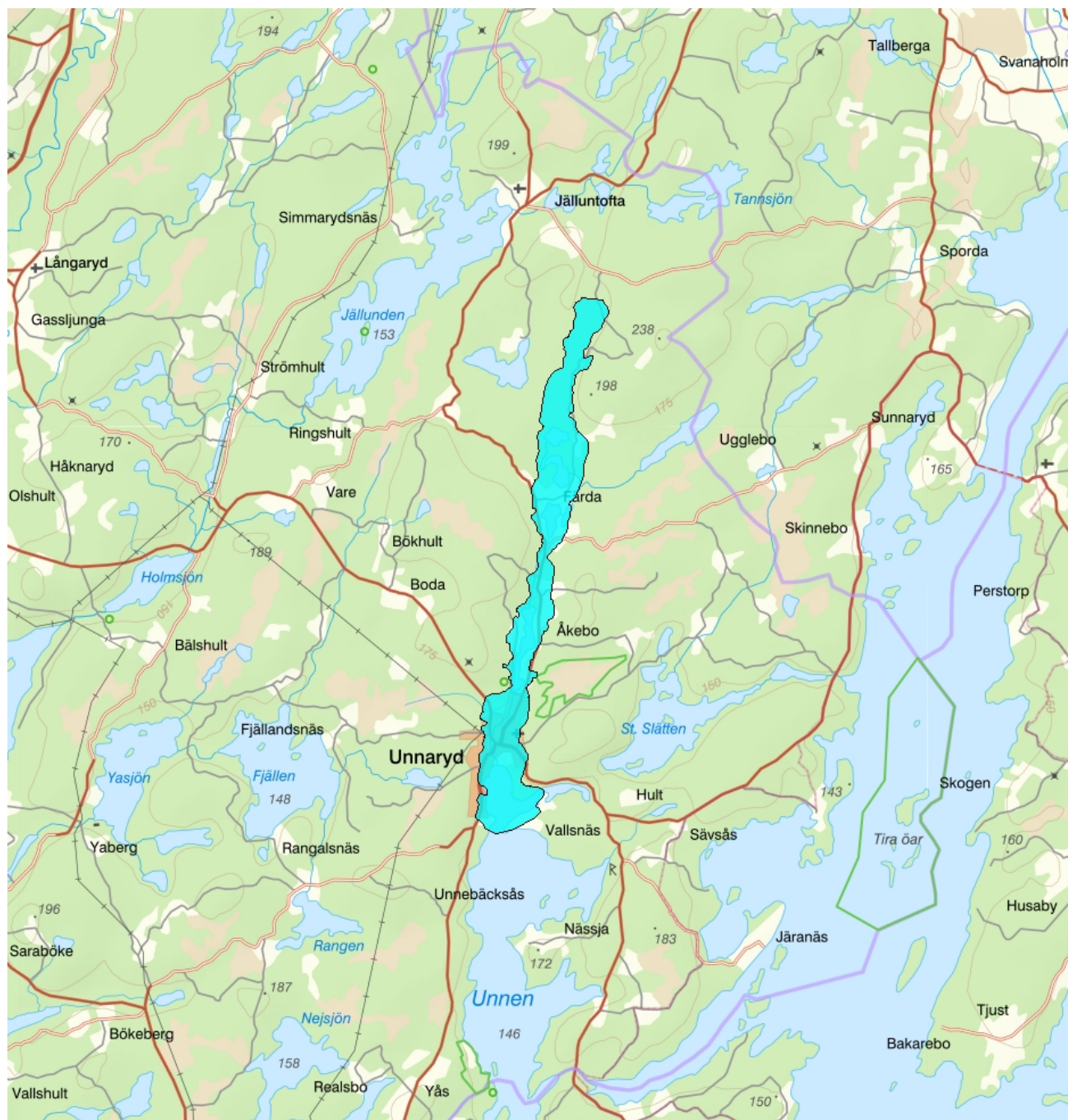
Förvaltningscykel 1 (2004 - 2009)