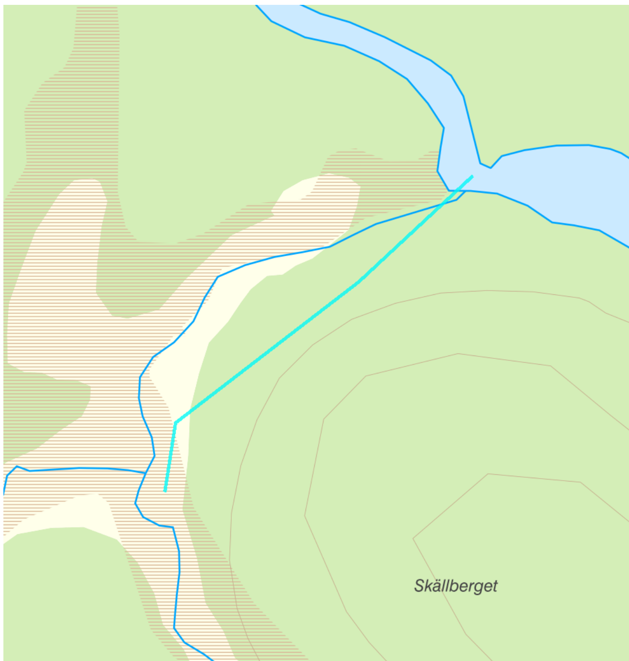
Förvaltningscykel 3 (2017 - 2021)