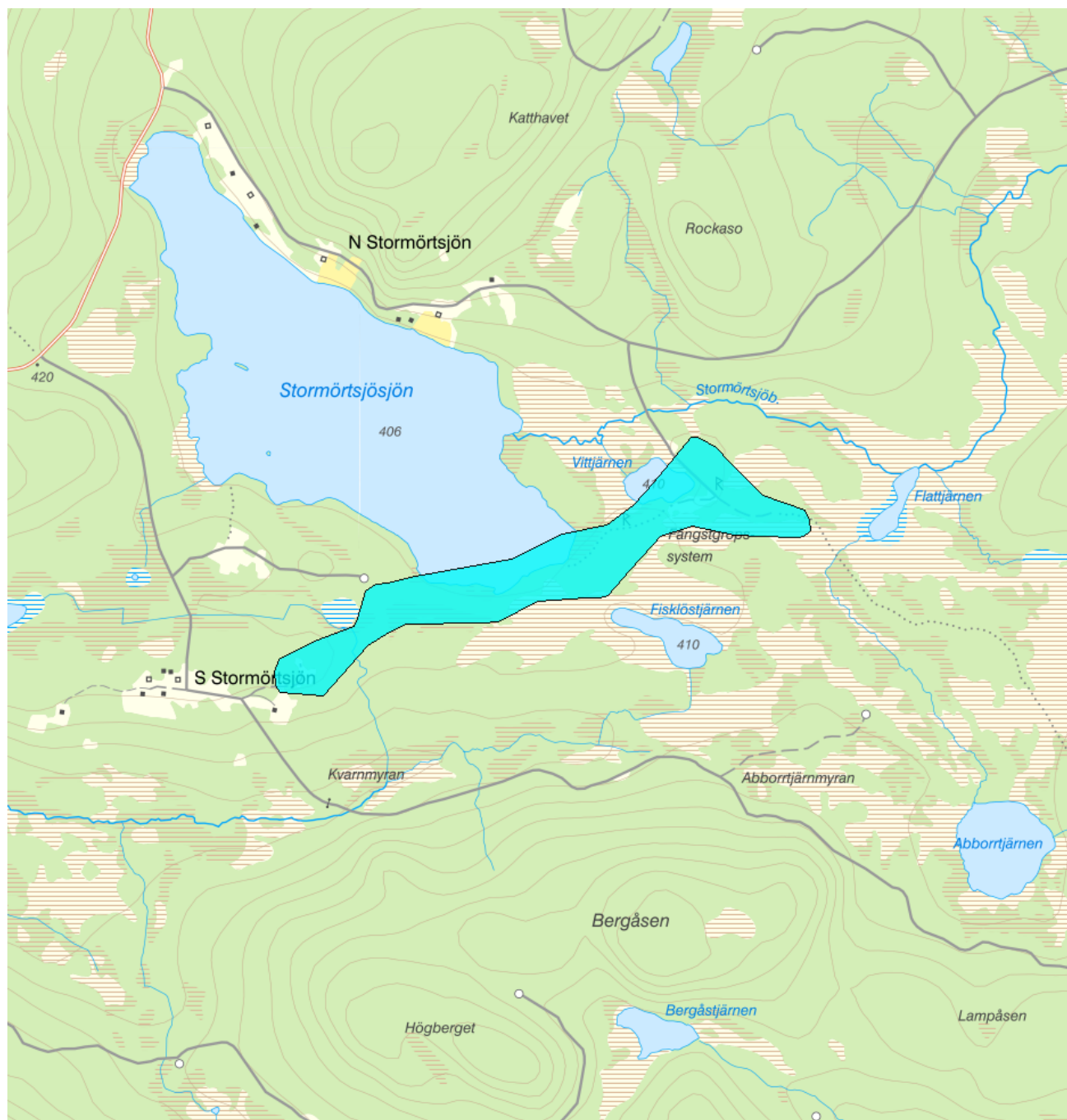
Förvaltningscykel 1 (2004 - 2009)