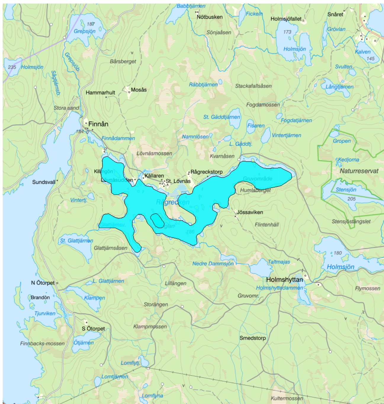
Förvaltningscykel 3 (2017 - 2021)