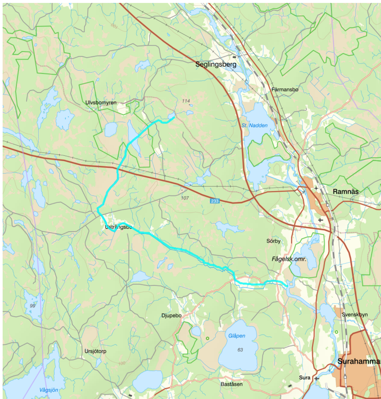
Förvaltningscykel 3 (2017 - 2021)