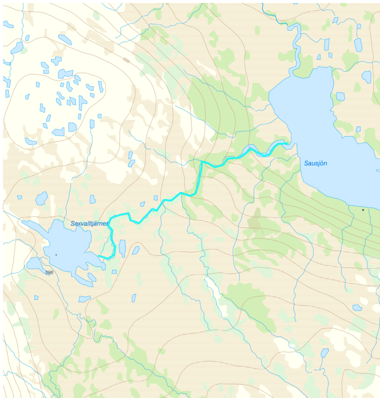
Förvaltningscykel 3 (2017 - 2021)