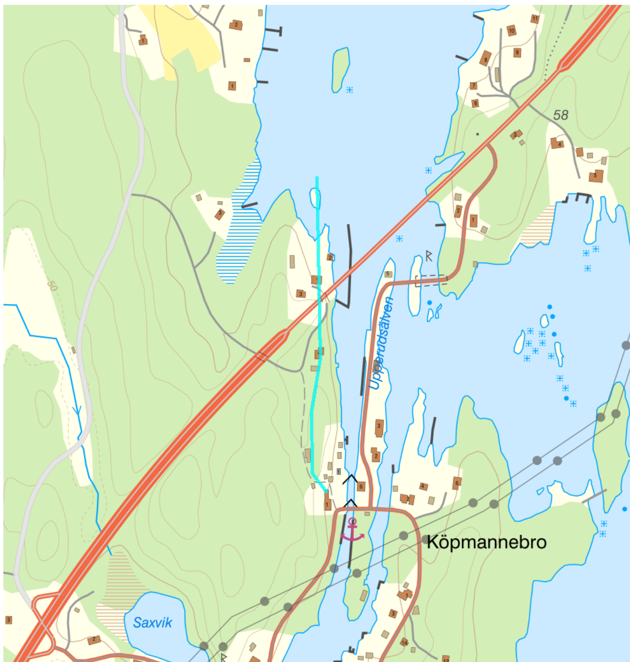
Förvaltningscykel 2 (2010 - 2016)