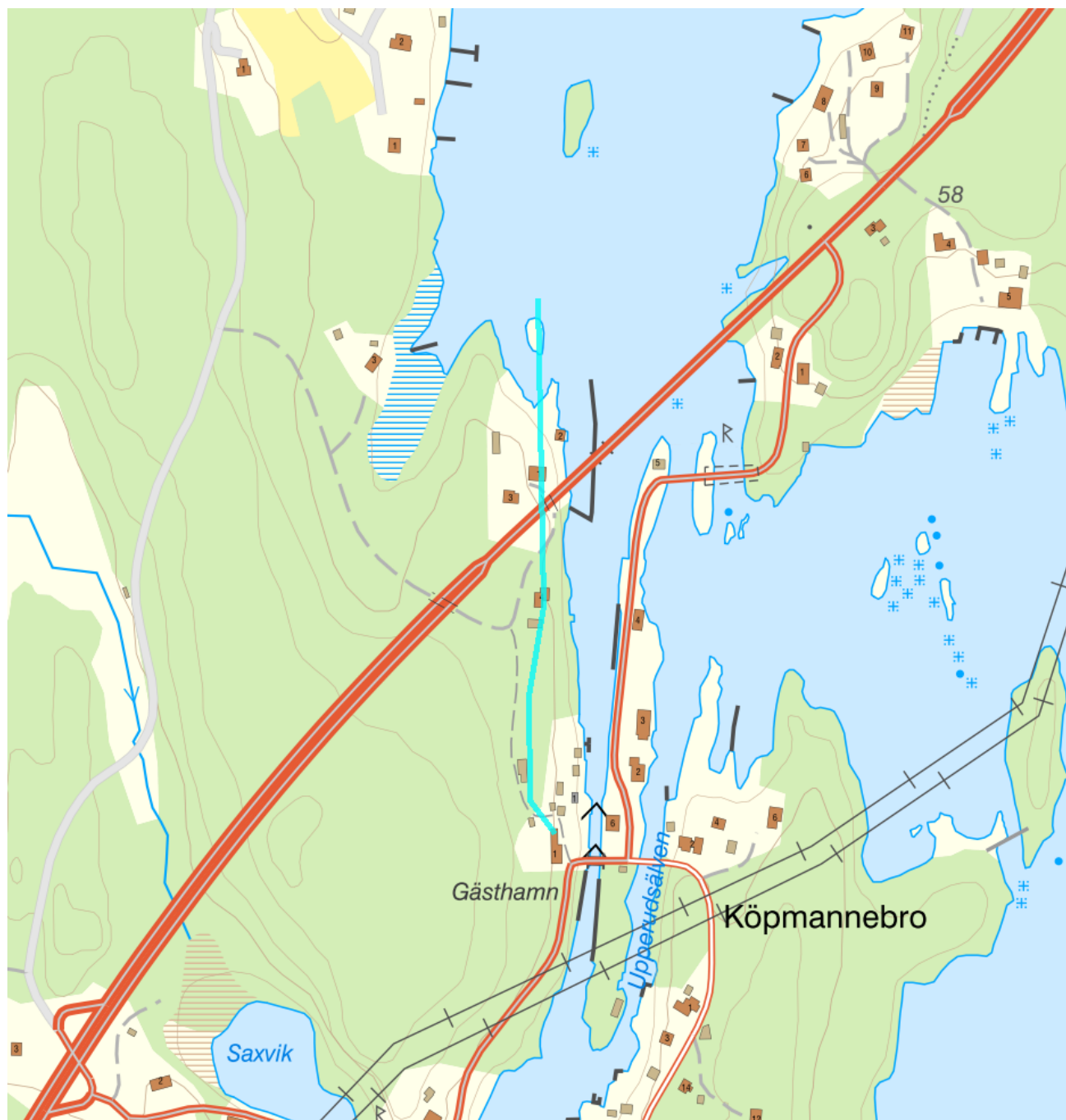
Förvaltningscykel 3 (2017 - 2021)