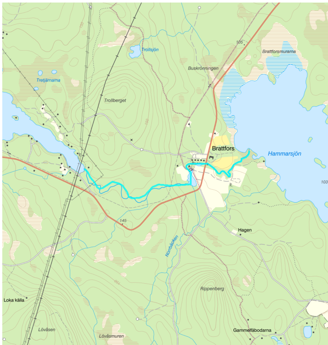
Förvaltningscykel 2 (2010 - 2016)