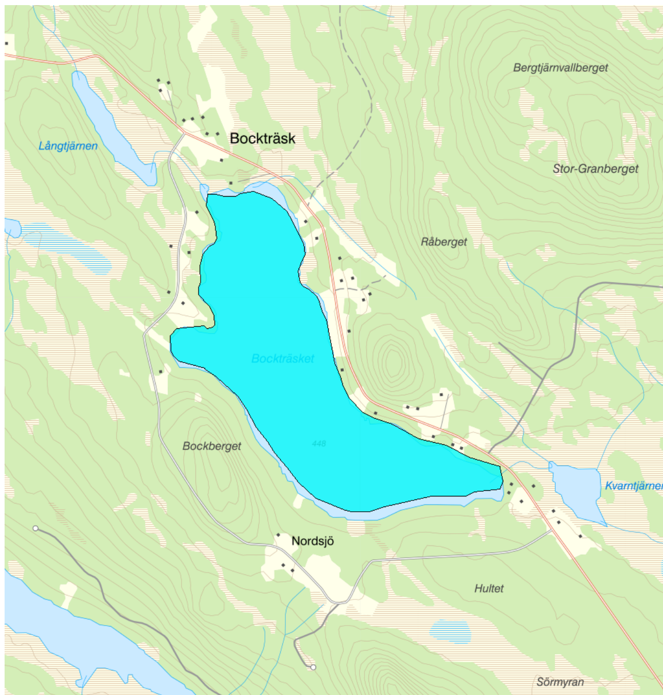
Förvaltningscykel 3 (2017 - 2021)