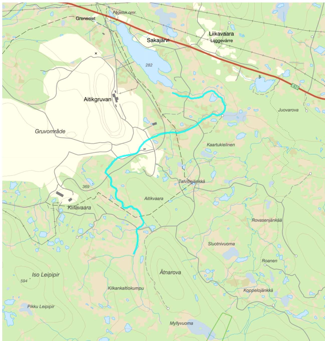
Förvaltningscykel 3 (2017 - 2021)