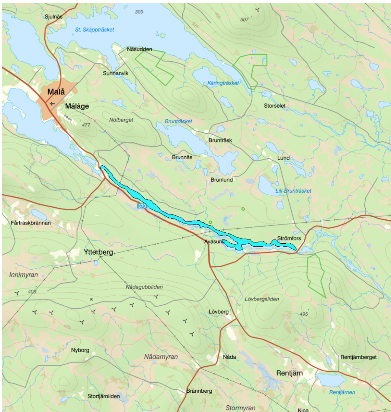
Förlängning av förvaltningscykel 2