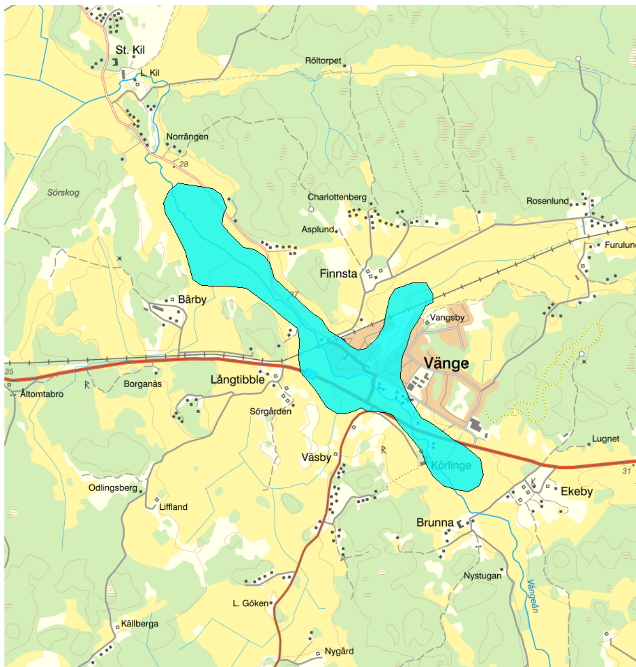
Förvaltningscykel 1 (2004 - 2009)