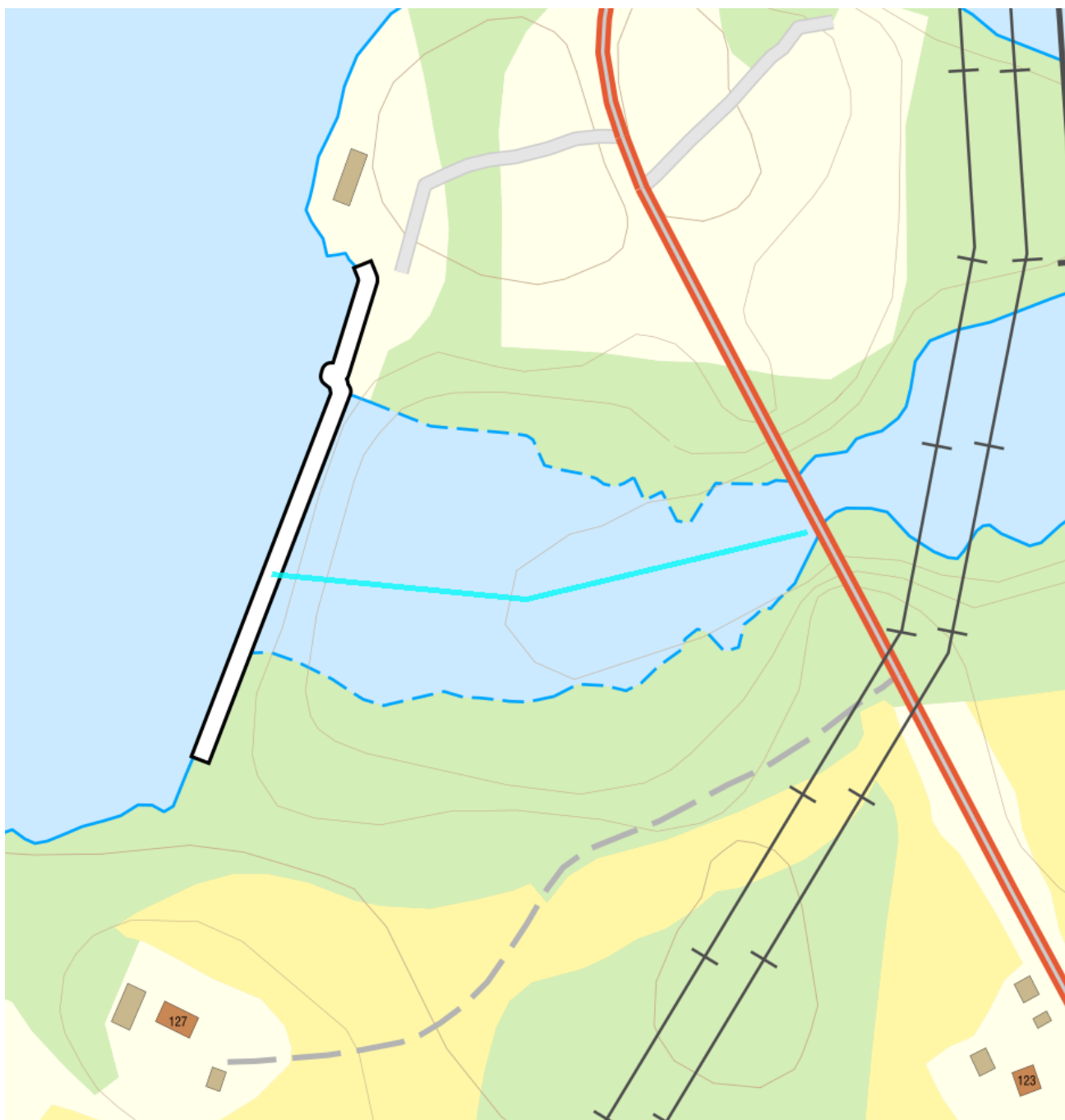
Förlängning av förvaltningscykel 2