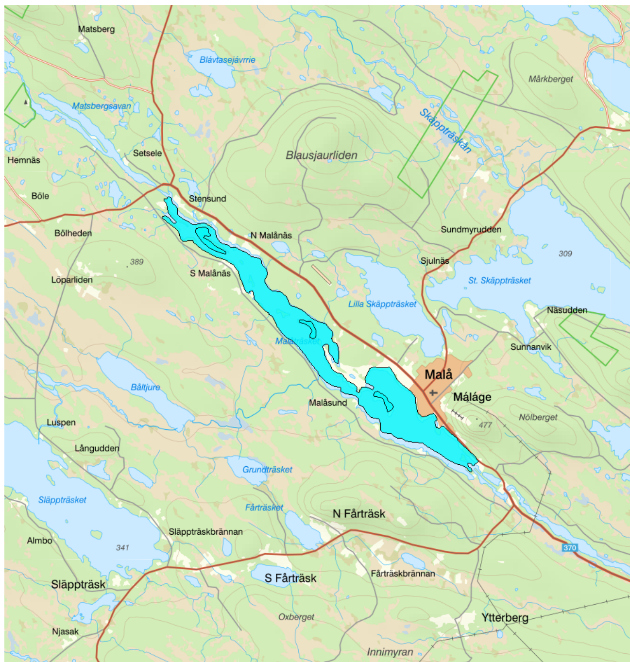
Förvaltningscykel 3 (2017 - 2021)